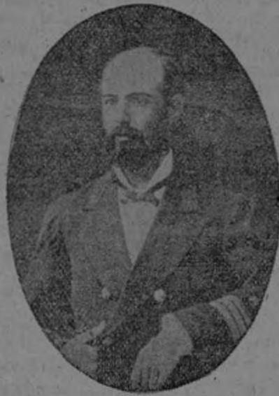
El valeroso CAPITÁN PRATT, héroe de la epopeya de Iquique

Mientras en la rada de Iquique la Esmeralda se batía con tanto heroísmo la Covadonga navegaba con rumbo al Sur. Este pequeño barco, capturado a los españoles en 1866, andaba cinco millas en cada hora y no tenía más defensa