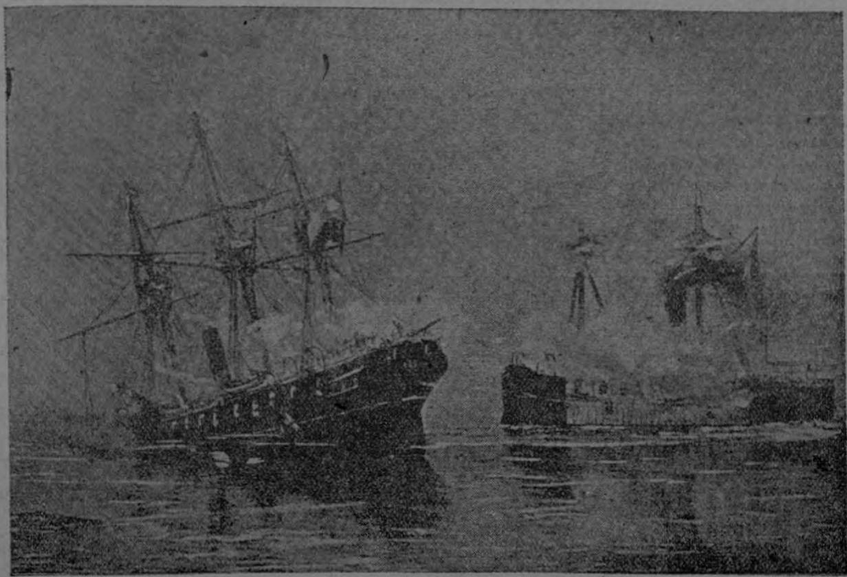
COMBATE NAVAL DE IQUIQUE.—21 DE MAYO DE 1879.

que dos cañones. En su persecución iba la fragata blindada Independencia , con andar de doce millas por hora y armada con 18 cañones de grueso calibre. Los peruanos estaban ciertos de apresarse a la goleta chilena y de antemano celebraban el triunfo, pero el Capitán Condell y sus oficiales habían jurado, como sus compañeros de la Esmeralda , aceptar la muerte antes que rendir la ban-